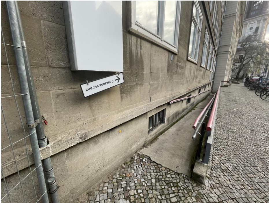
Übergang von der U-Bahn (rechts) zur Rampe auf der linken Seite: